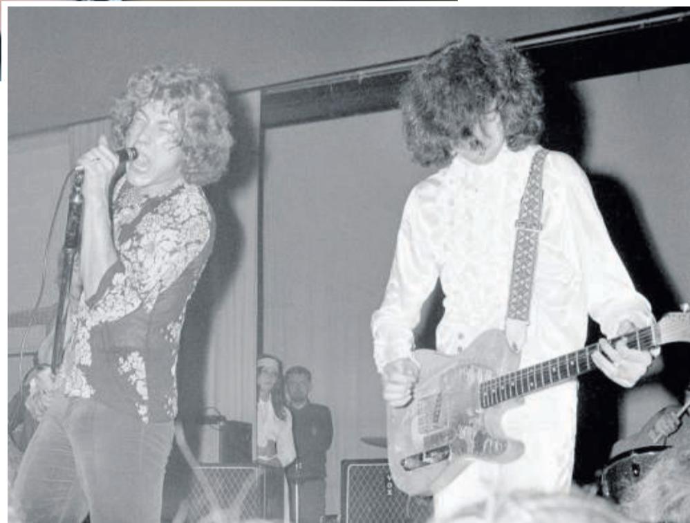
Robert Plant og Jimmy Page på scenen på Egegård Skole til deres første liveoptræden sammen.

Den pågældende aften, hvor The New Yardbirds spillede