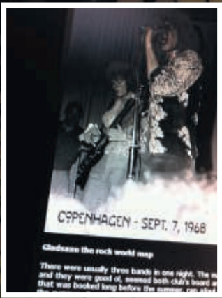
Et blik på Led Zeppelins officielle hjemmeside, der sætter Gladsaxe på rockens verdenskort.