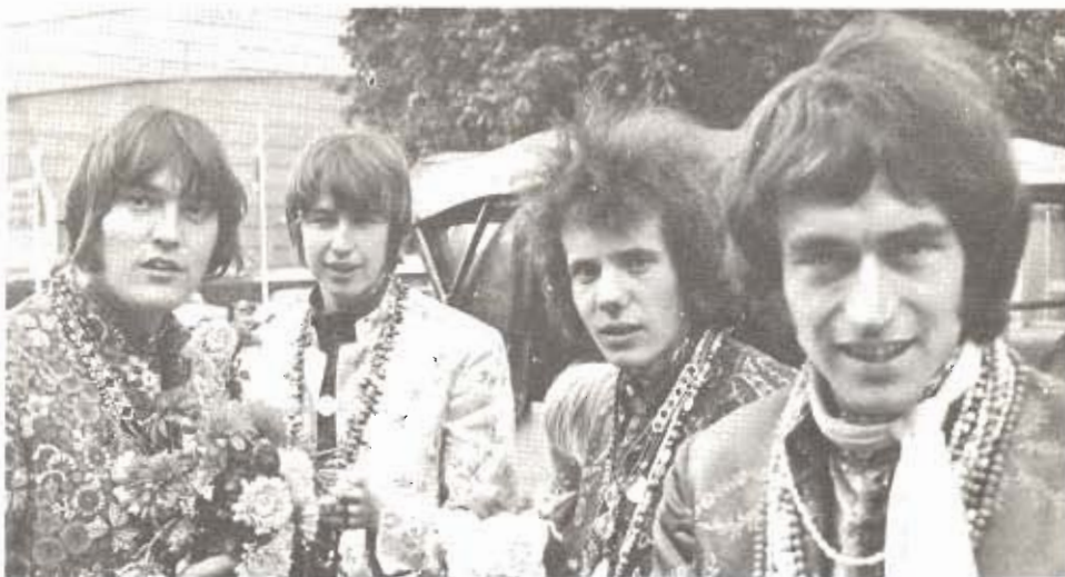
WISHFUL THINKING I TEEN-CLUB'EN 14. SEPTEMBER