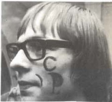
Ekstrabladet's popskribent med hippie-maling ved et popbal i KB-Hallen.

Det skulle vist ikke være nødvendigt at lave så megen ståhej om den sag.