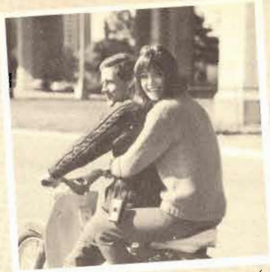
Kold godt fast... nu letter vi!