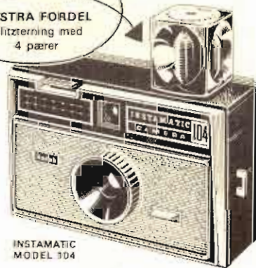
INSTAMATIC MODEL 304