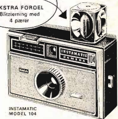
INSTAMATIC MODEL 104

Blitztæringen drejer selv med. De får 4 skarpe blitzbilleder uden at skifte pære.